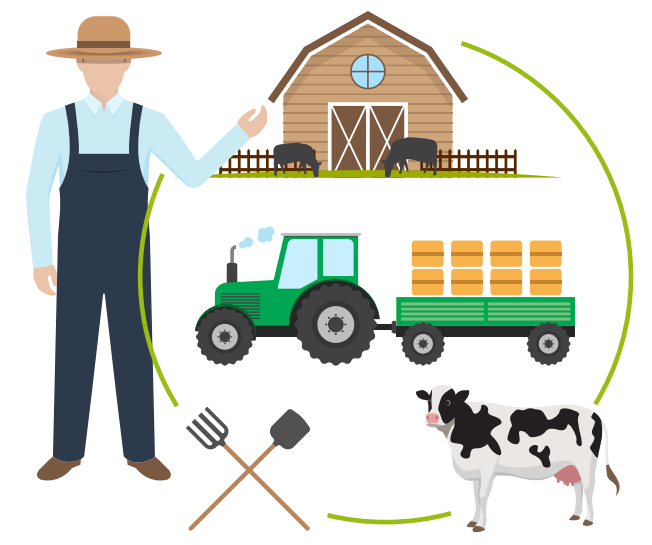
Técnico en Producción Pecuaria