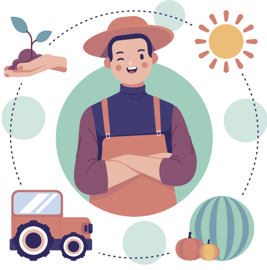
Técnico en Sistemas Agropecuarias Ecológicas