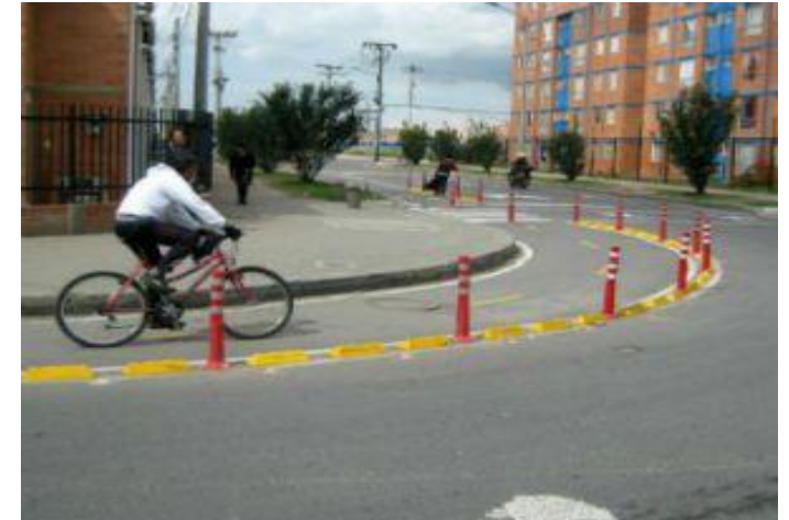
CicloRuta en calzada