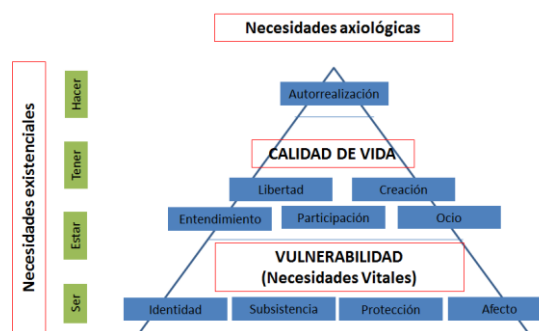
Figura 3. Necesidades humanas, integrando las teorías de Maslow y Max-Neef.

Fuente: Esquema original del autor basado en las teorías de Max-Neef (1998) y Maslow (1991).